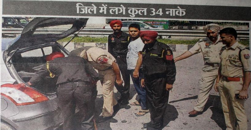
जिले में लगे कुल 34 नाके